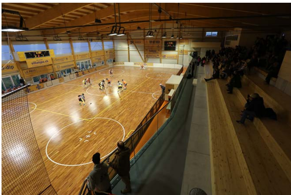
La salle des sports de Rossemaison (Forum BIWI).

Les fiches sont téléchargeables sur www.lignum-jura.ch . Lignum Jura renouvelle ses appels à réaliser d'autres fiches. Elles ont toutes la même vocation d'être de bons exemples.