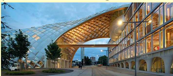
Siège de la marque Swatch, Bienne, 2019

Maître de l'ouvrage: Swatch SA, Bienne; Architectes: Shigeru Ban Architects Europe, Paris; Itten + Brecht AG Basel, Bern; Ingénieur bois: SJB Kempter Fitze AG, Eschenbach; Ingénieur protection incendie: Bois Initial, Morges; Constructeur bois: Blumer-Lehmann AG, Gossau.